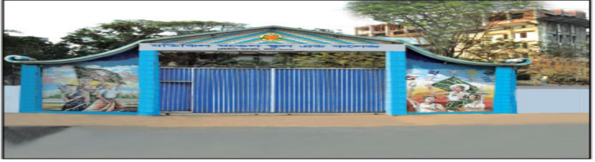
মতিঝিল মডেল স্কুল এন্ড কলেজ-এর প্রধান ফটক

ধাপ ৩ : নতুন স্ক্রিনে আপনার আবেদনের User ID প্রদান করে Login বাটনটি চাপুন।